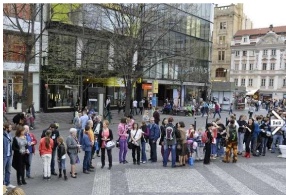
Fronta před knihkupectvím na Václavském náměstí.