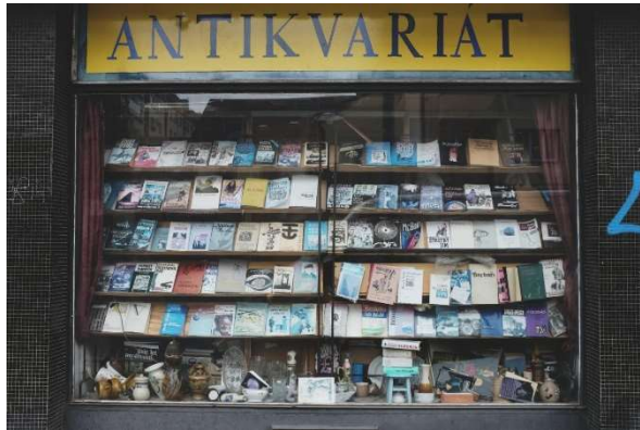
Jeden z Pražských antikvariátů potýkajících se s nedostatkem zboží

Nabádáme tedy naše čtenáře ke zvýšené obezřetnosti. Kdo ví, co nám nejbližší dny připraví.