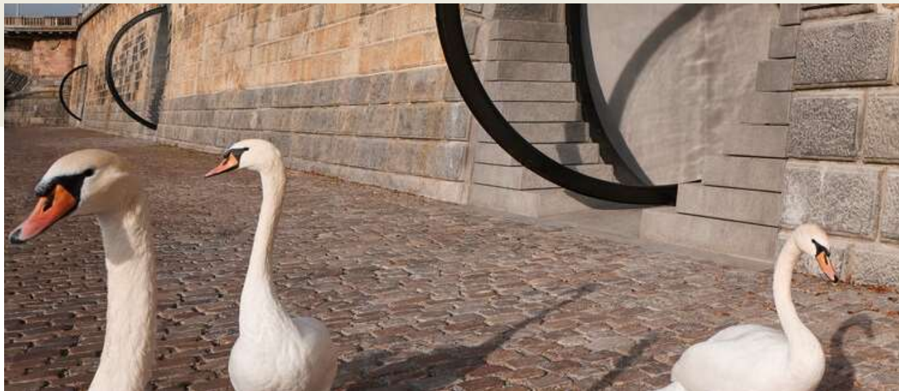
Labutě na obchůzce